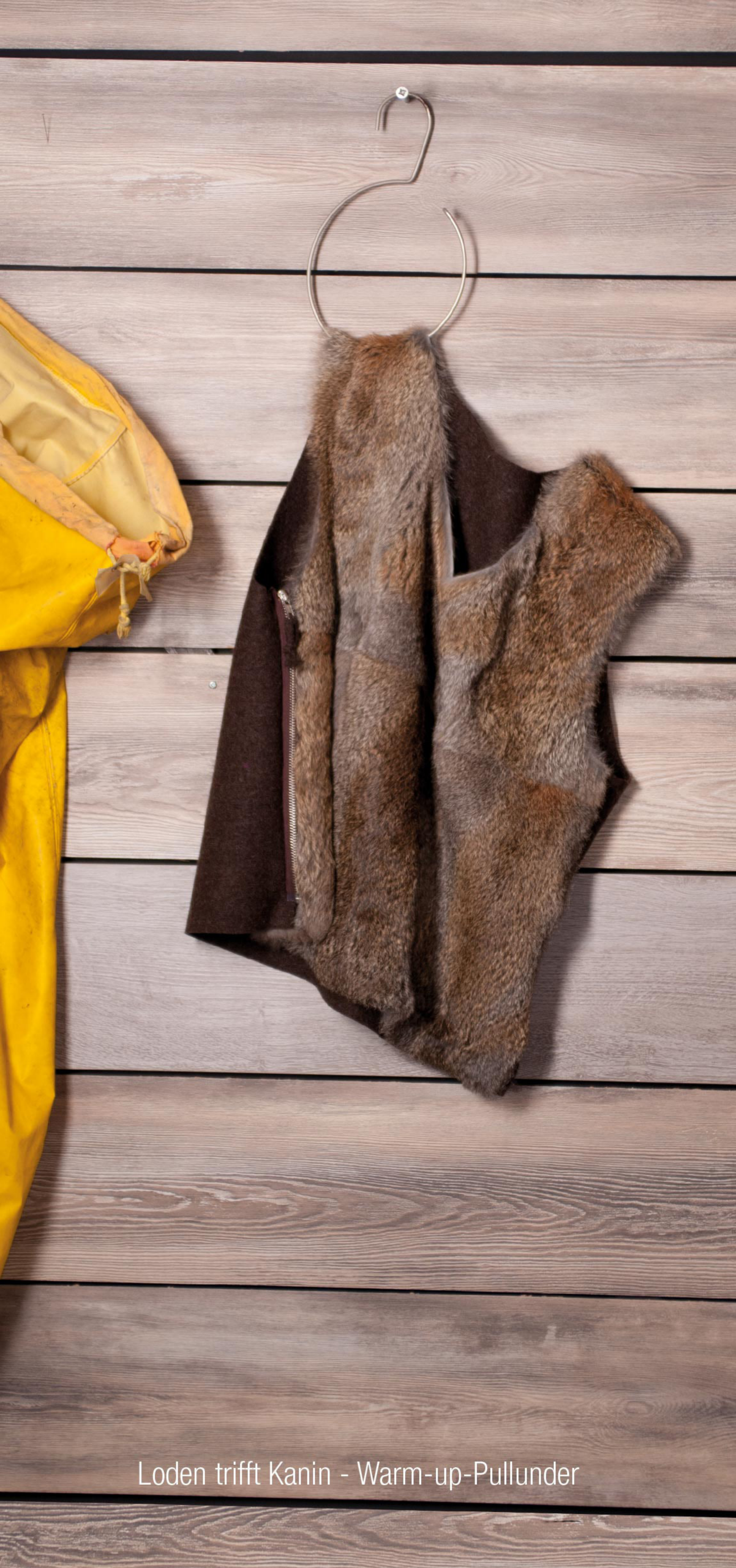
Loden trifft Kanin - Warm-up-Pullunder