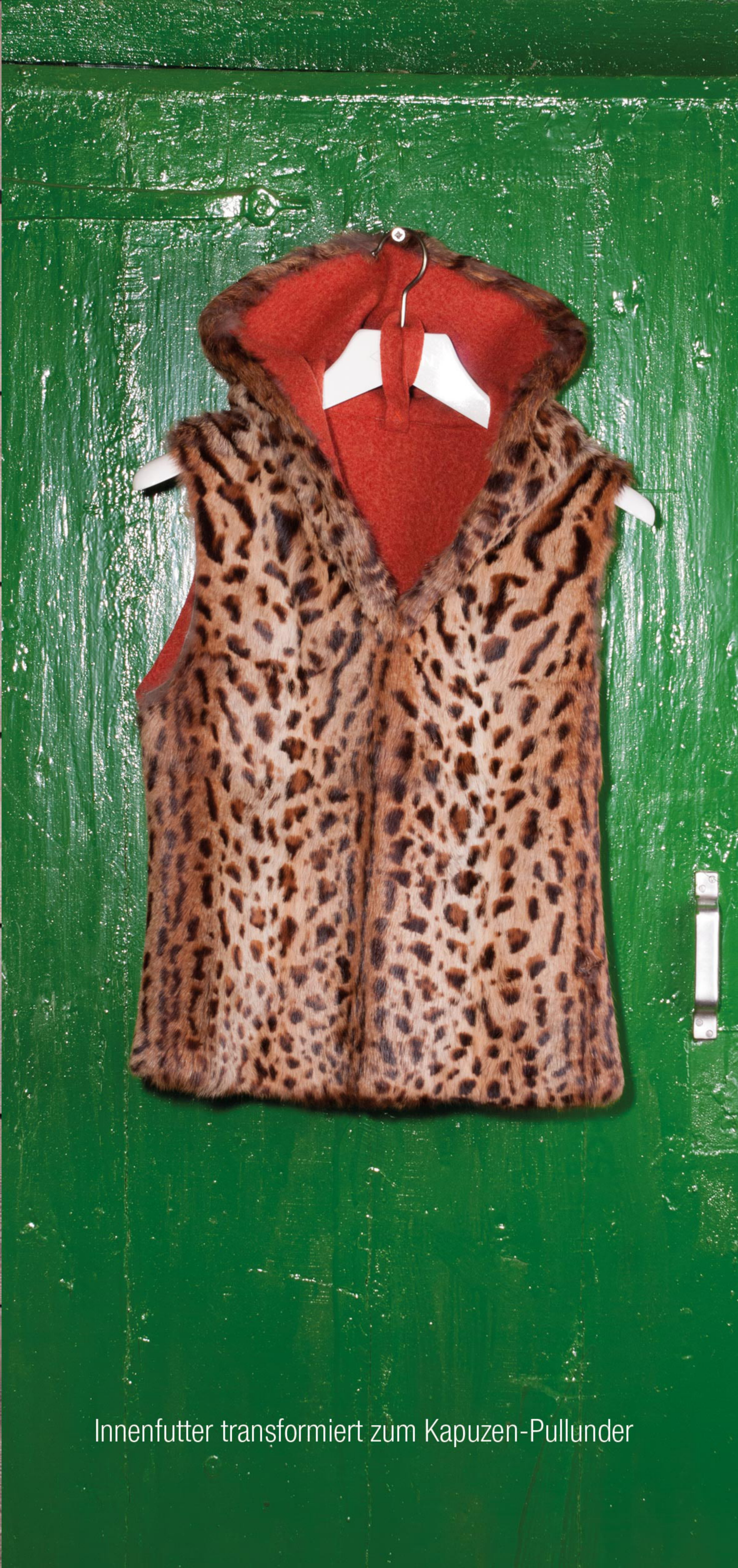
Innenfutter transformiert zum Kapuzen-Pullunder