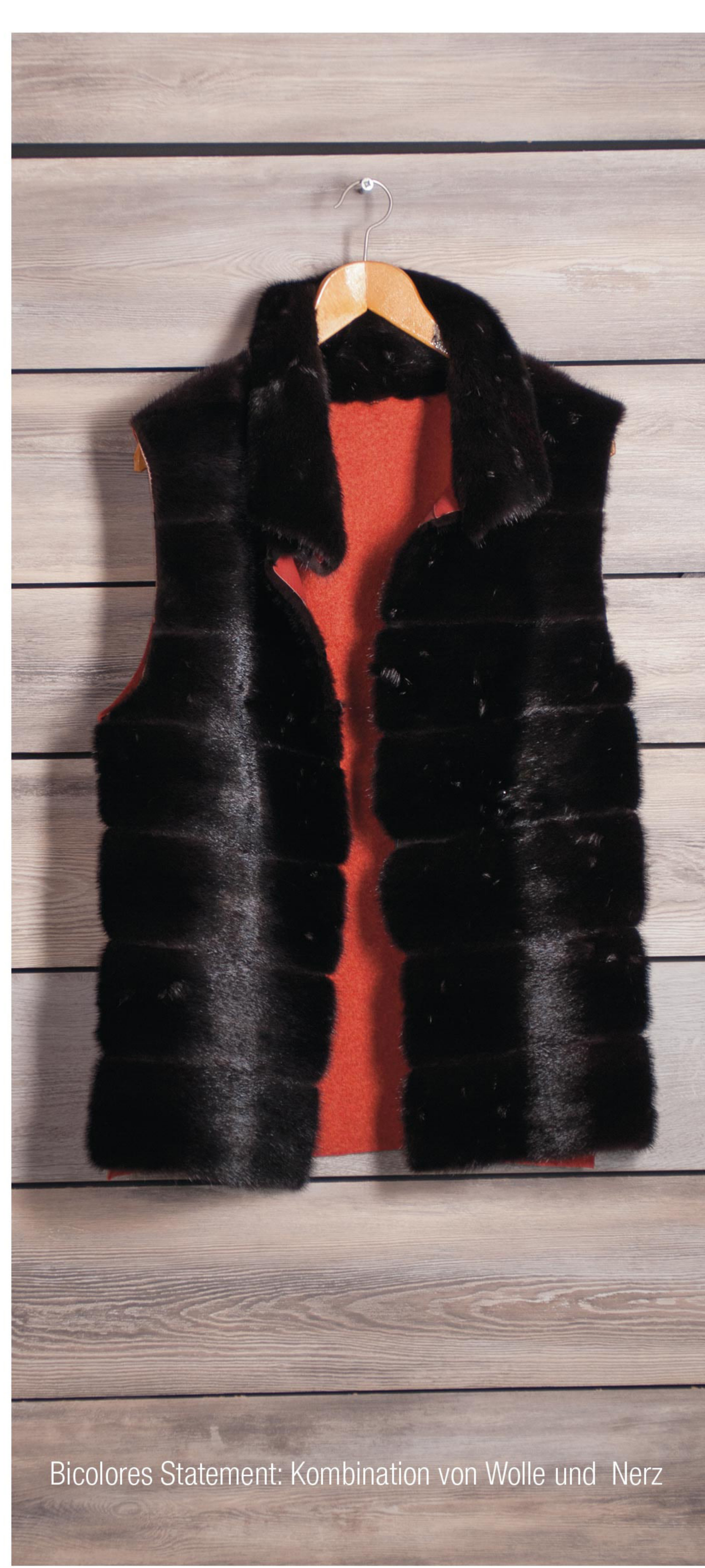
Bicolores Statement: Kombination von Wolle und Nerz