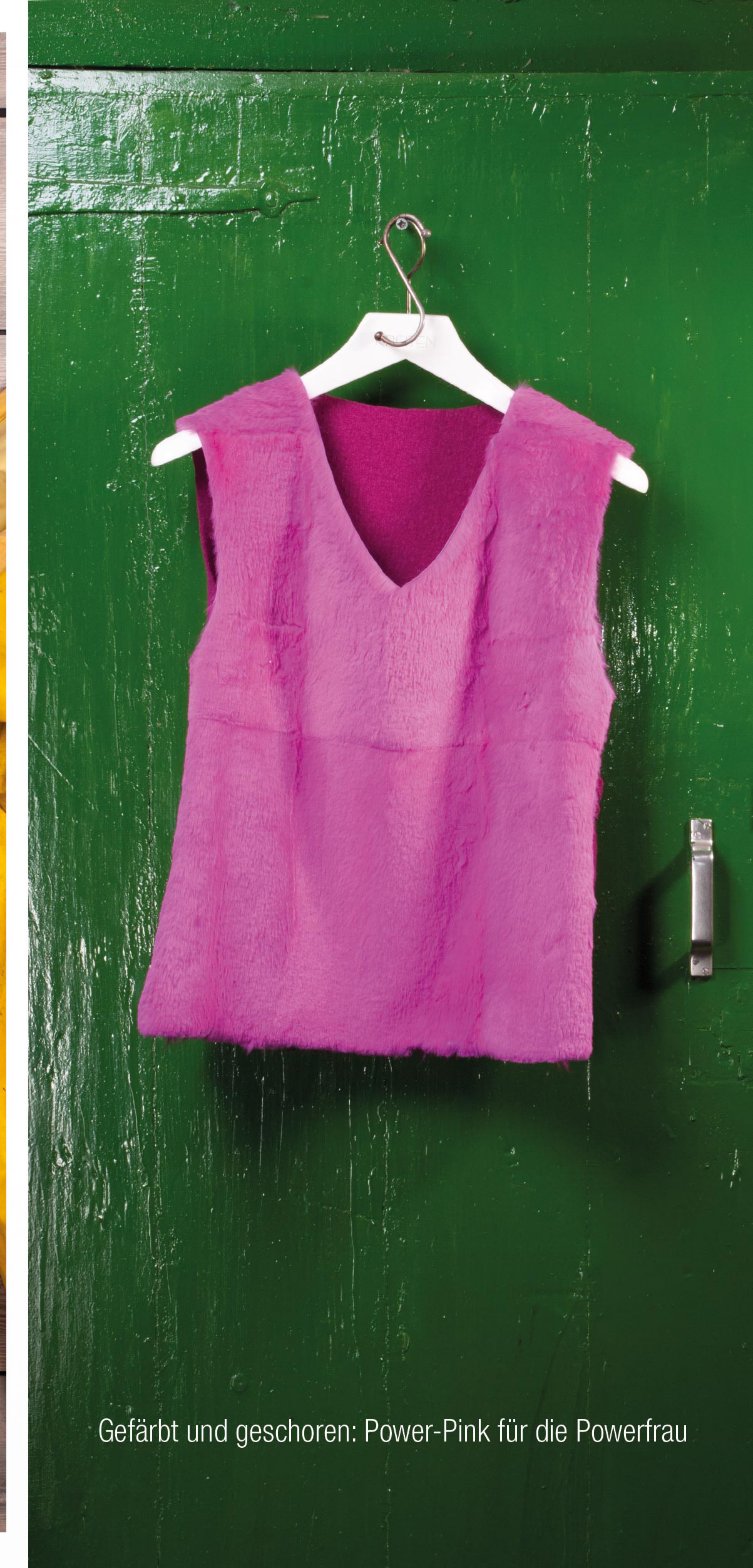
Gefärbt und geschoren: Power-Pink für die Powerfrau