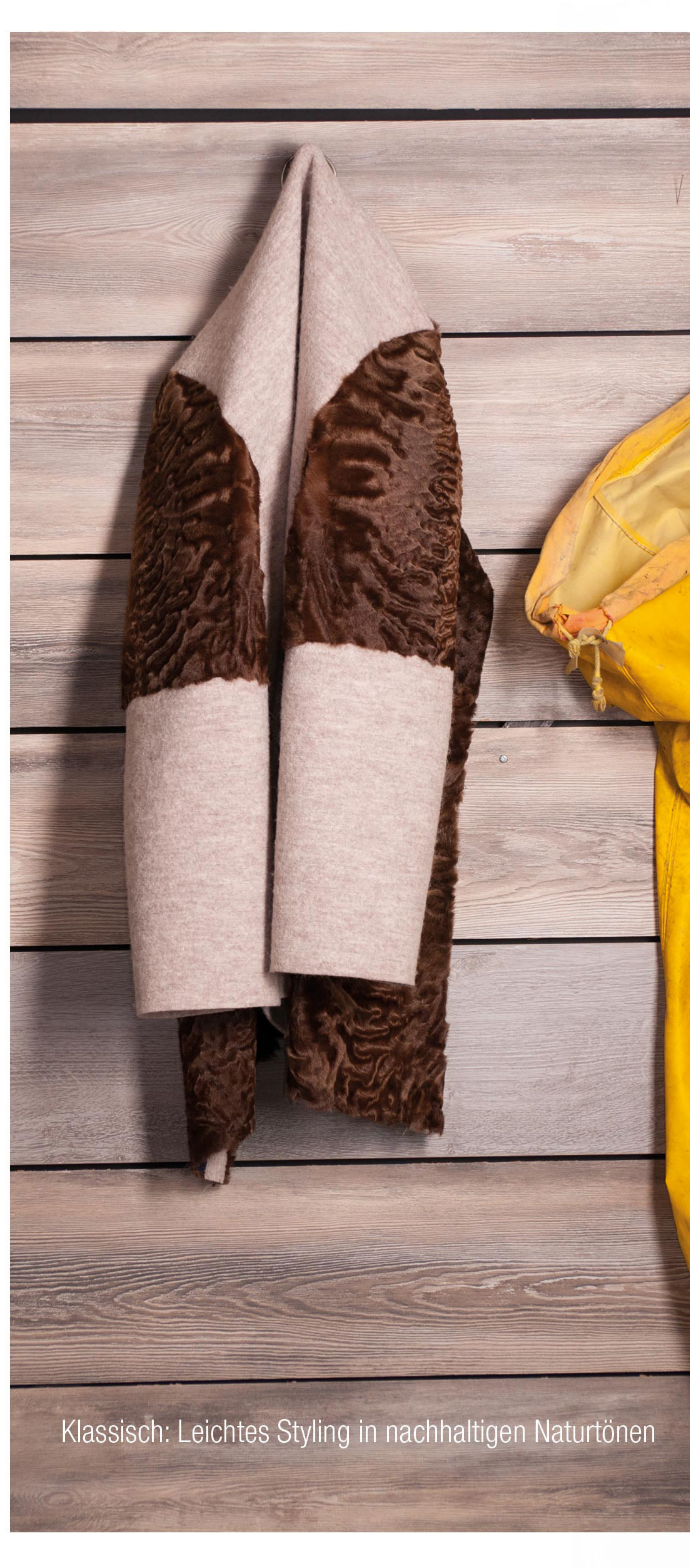
Klassisch: Leichtes Styling in nachhaltigen Naturtönen