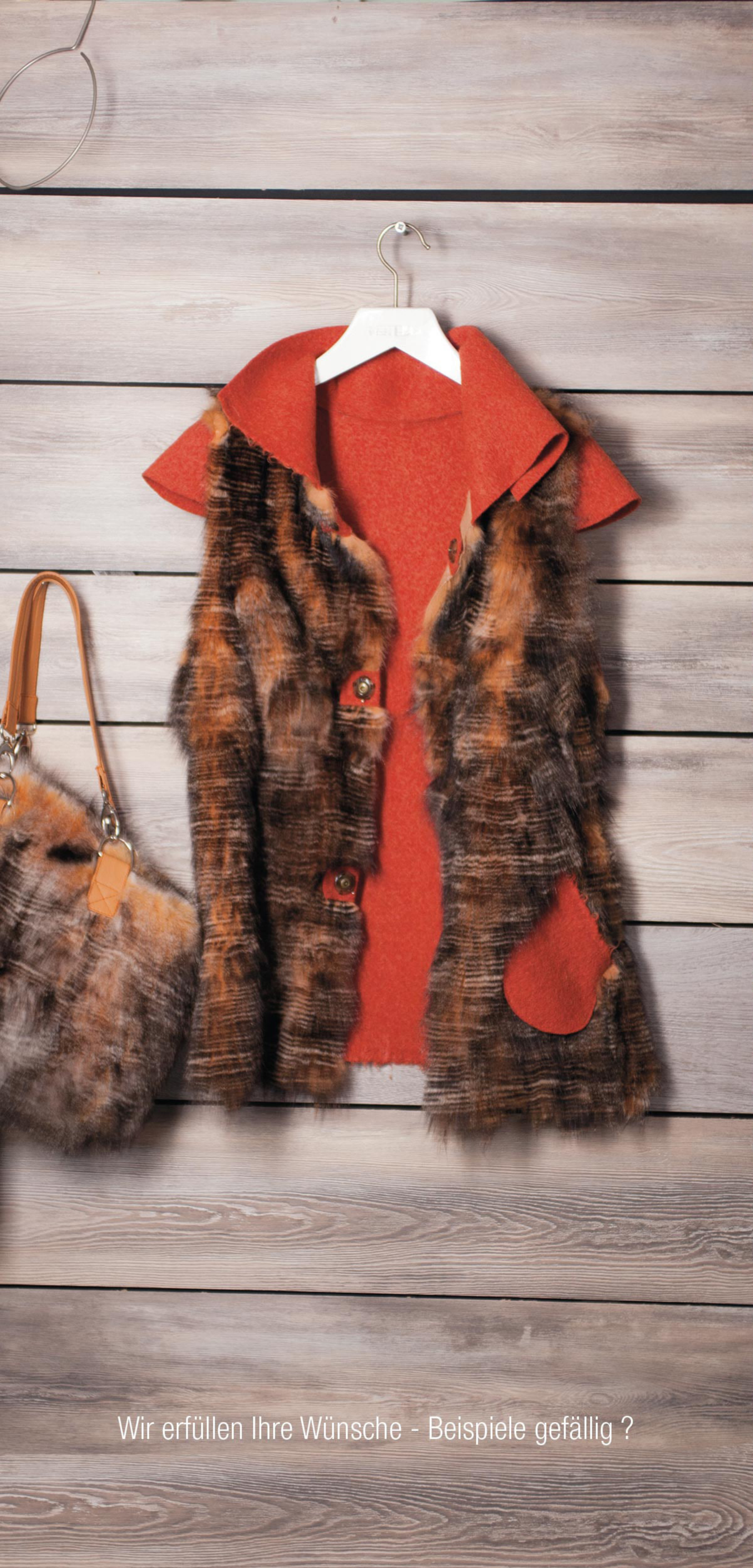
Wir erfüllen Ihre Wünsche - Beispiele gefällig ?